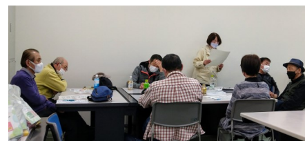
2グループに分かれて検討会を行いました。