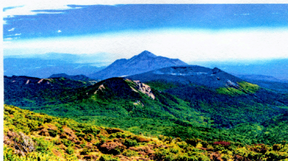
鹿児島県との県境にあり、 高千穂の峰がそびえ立つ

A 災害時のひきこもり者への対応は重要と考えている。まず自治会、民生委員・児童委員やひきこもり家族会等と連携して、ひきこもり実態調査に努めるとともに、来年度から事業実施を予定している訪問支援を通じて、ひきこもり状態にある方及びそのご家族との信頼関係の構築を図り、当事者が抱える一つ一つの課題の解決につなげて参りたい。