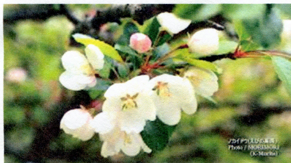
えびの高原のノカイドウ 世界に唯一宮崎県えびの市の 「えびの高原」だけに咲く花

②アニメの「ガンダムシリーズ」では、直感力や洞察力が他の人に比べて高度に備わっている人を指す言葉として、「ニュータイプ」という言葉がある。発達障がいを持つ方たちの中には、そういう特徴を持つ人も多いため、「ニュータイプ」という言葉も良いのではないか、という意見も出ました。