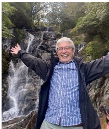
八おき塾のホームページから